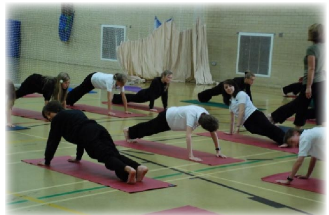
Bl 9 yn cael sesiwn ioga