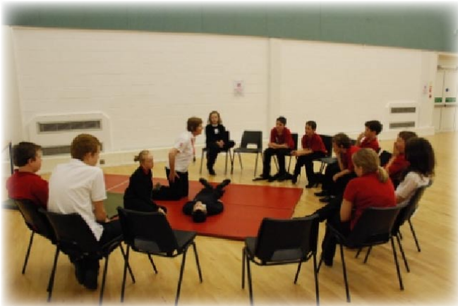
Sesiwn cymorth cyntaf gyda bl 7

Cafwyd diwrnod ABCh llwyddiannus unwaith eto ar ddiwedd mis Medi. Bu sesiynau diddorol tu hwnt ar gyfer yr holl ddisgyblion gan gynnwys ioga, cyflwyniad gan y Llyfrgell Genedlaethol, dinasyddiaeth, gwylwyr y glannau, bywyd mewn carchar a gwrth-fwlian.